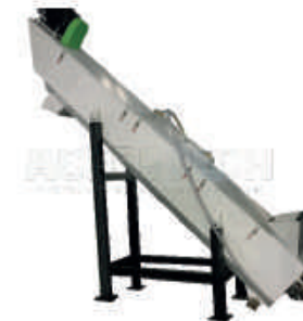
Myjka ślimakowa (wolna)