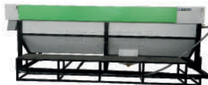
Wanna flotacyjna 2