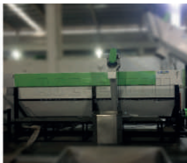
Wanna flotacyjna 1