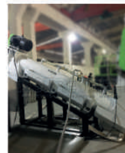
Myjka ślimakowa 2 (szybka)