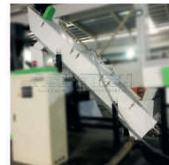
Myjka ślimakowa (wolna)