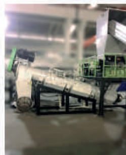
Myjka ślimakowa 1 (szybka)